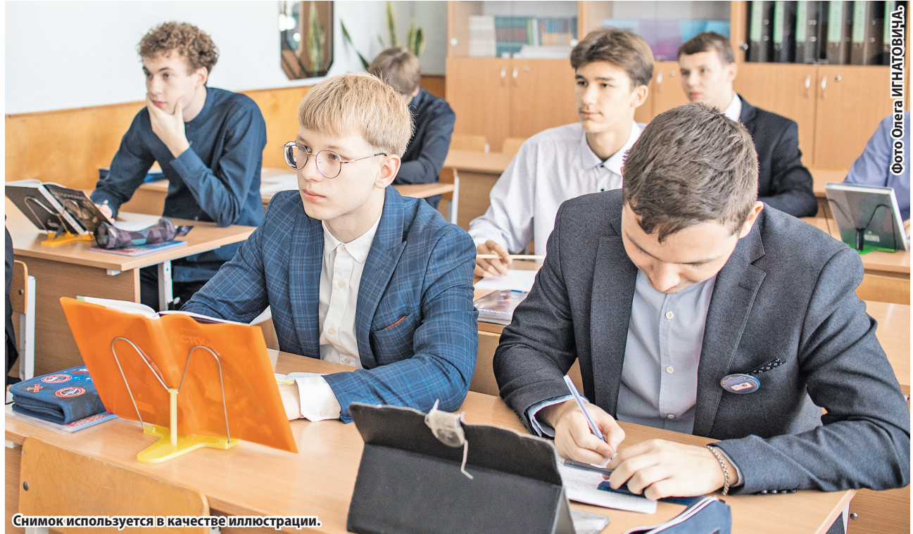
Снимок используется в качестве иллюстрации.

Задания В6 и В7 были направлены на выявление знаний по теме «Основные классы неорганических соединений». Средний показатель выполнения задания В6 равен 66 %. Более 11 % участников ЦЭ допустили ошибки в реакциях между растворами солей и растворами кислот. Около 8 % экзаменуемых для превращения фосфата железа(II) в соот-